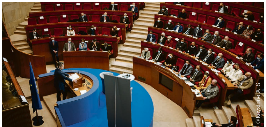
Le Forum de l'islam de France n'est pas définitif : il devrait faire émerger de nouvelles figures de représentativité au sein de l'islam français.

Quant au Forif, il apporte une réelle ouverture : « On abandonne l'idée de la représentativité, qui faisait polémique, pour la cooptation administrative et une approche pragmatique, centrée sur des dossiers concrets », observe Claire de Galember. De plus, le Forif redonne l'initiative au niveau local. « Ce n'est pas une solution imposée par le sommet, mais bien issue de la base », observe Francis Messner. Les bases d'un renouveau fondamental sont donc posées. Camille Andres