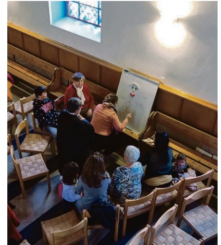
Une célébration en remplit de vie et déplacements.

Dimanche 17 avril , culte à Ballaigues à 10h avec la cène. Pâque: Le miracle de la résurrection nous donne accès auprès du Père. « Mort ou est ta victoire? »