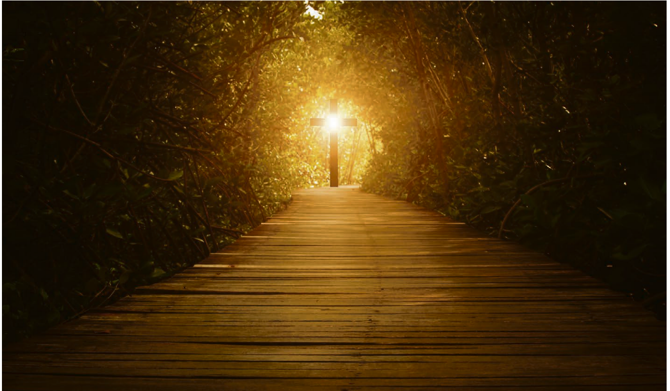
En marche, pour méditer, partager, redécouvrir.