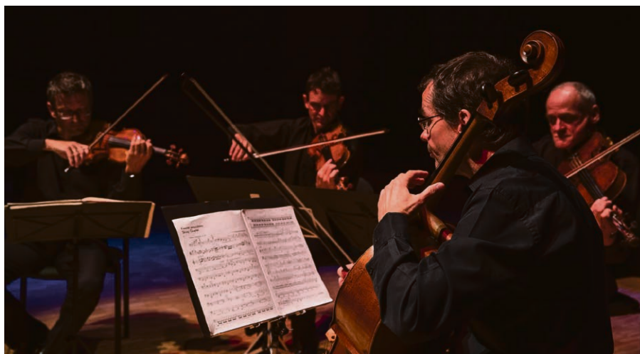
Quatuor Sine Nomine en concert à Romainmôtier.