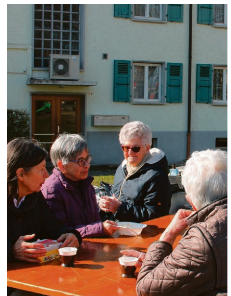
Un moment convivial autour de la soupe.