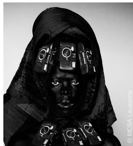
Zanele Muholi, Thathu I.

« Résister, encore », jusqu'au 15 mai, MCBA, www.mcba.ch .