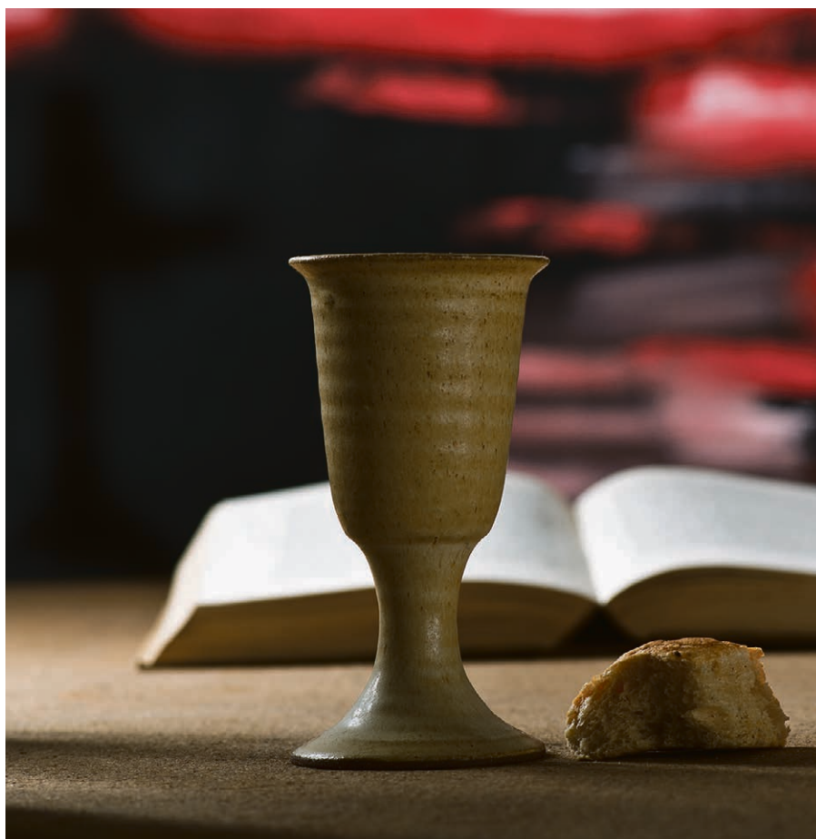
Retraite pour réfléchir à la sainte cène, mercredi 13 avril.

Pour toute information complémentaire, contactez Noémie Emery, pasteur stagiaire au 079 327 78 31 ou par e-mail à ncemie.emery@eerv.ch .