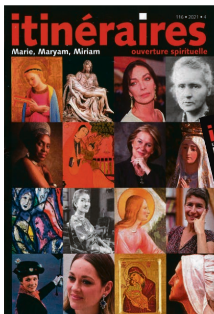
Le dernier numéro d' Itinéraires était consacré à « Marie ». Le thème du prochain : « Peurs ».