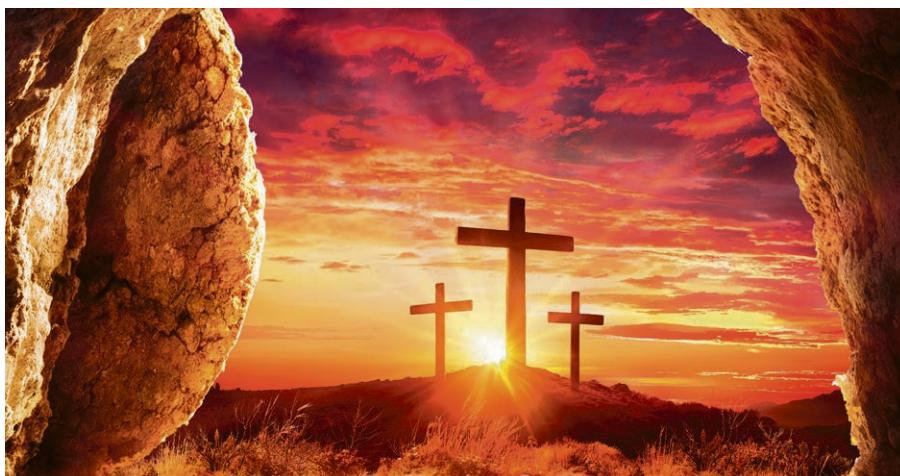
Pâques continue en chacun de nous.

«... à nous qui croyons en celui qui a réveillé d'entre les morts Jésus notre Seigneur, lequel a été livré pour nos fautes et ressuscité pour notre justification (c.a.d. pour notre salut)» Romains 4,25.