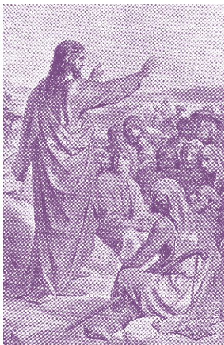
Jésus a transmis son enseignement par oral, comme ici lors du sermon sur la montagne.